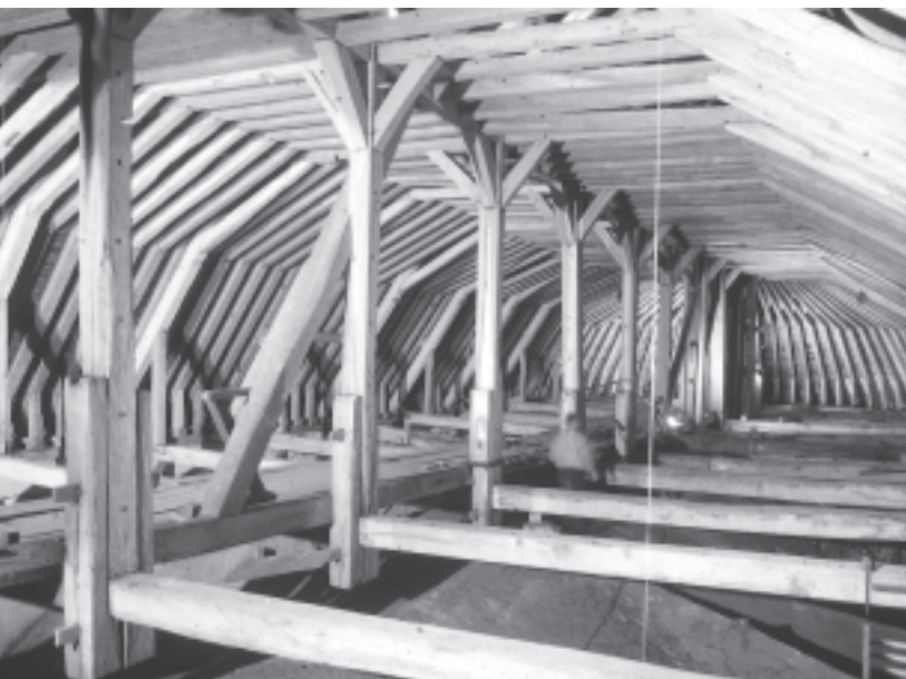
Charpente du chœur de la cathédrale de Beauvais.