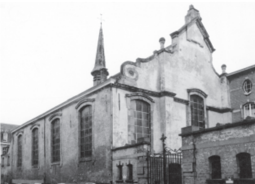
Ancien couvent Saint-Augustin à Enghien, 1997.