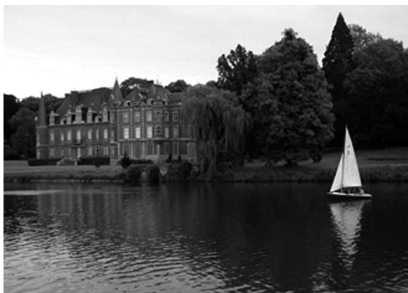
Cliché, J. Chech.