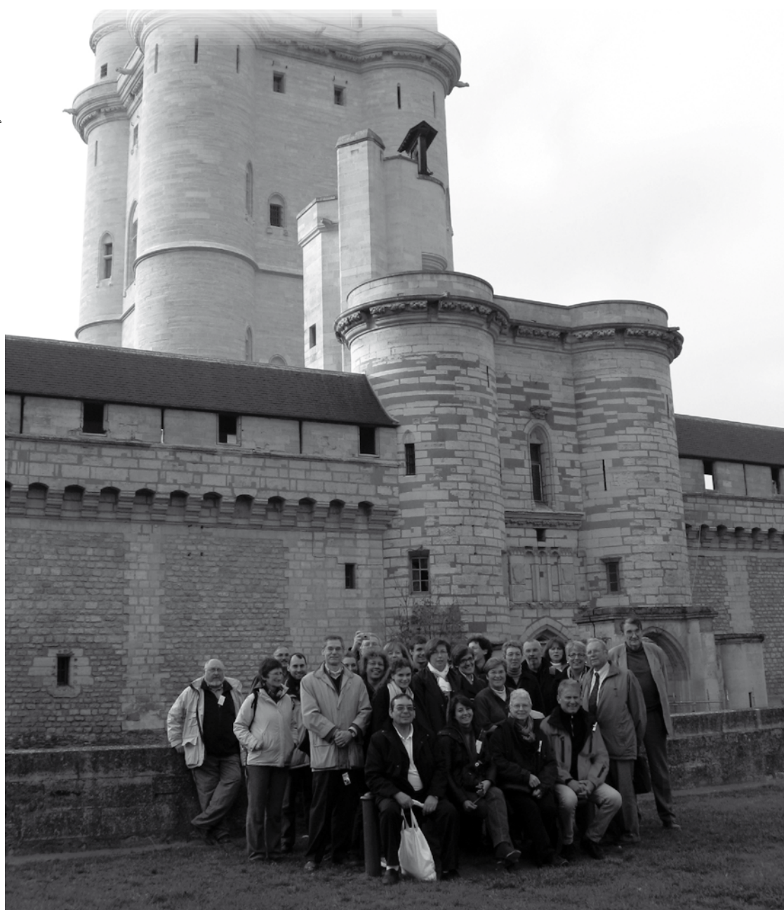
Le groupe rassemblé au pied du donjon de Vincennes.

les pierres, l'utilisation d'inhibiteurs de corrosion pour la protection de surface métallique, etc.). La visite de chaque pôle, effectuée sous la houlette des chercheurs responsables, fut illustrée d'exemples et accompagnée d'explications sur les techniques utilisées dans ces recherches. Elle a permis de se rendre compte de la pratique du travail des chercheurs, des machines employées, de la taille des locaux, du contexte de recherche, etc. ... chacun pouvant poser des questions... ce qui fut amplement le cas !