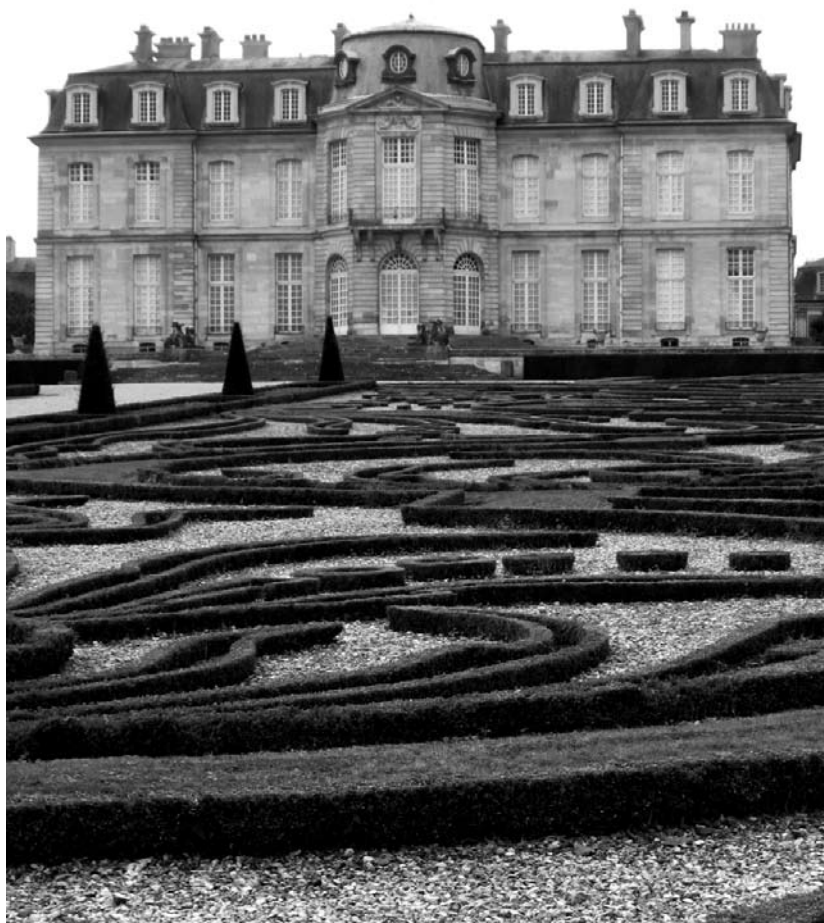
Le château de Champs-sur-Marne.

La présentation dynamique et passionnante de la directrice du LRMH a permis le partage de certains résultats d'études sur la conservation des monuments (par exemple sur les contre-vitrages comme protection, sur le mortier biologique utiliser pour le colmatage de fissures, etc.) et sur l'efficacité de certains traitements (par exemple l'utilisation d'hydrofuges sur