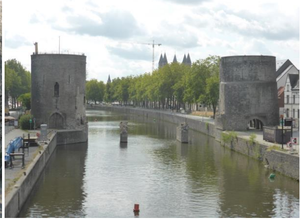
« Pont-des-trous » le 12 août 2019