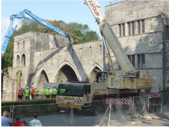
« Pont-des-trous » le 2 août 2019